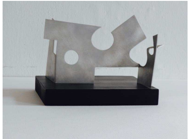
J-Pillhofer, Raumkonzeption III/2, 2000, Aluminium geschliffen auf schwarzem Holzsockel, 21x12,5x15 cm

An den Kanten entlangehend erkennt das Auge Flächenkrümmungen, die Spannung schaffen. So entfalten diese Formkonzentrate auf knappstem Raum einen Reichtum von integrierenden, einander antwortenden und gegensätzlichen Beziehungen, die den eigentlichen Gesprächsstoff ausmachen, wenn man sein Atelier betritt. ]