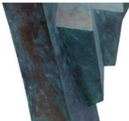
— Pillhofer: Sitzender, 1964, Tusche, 42 x 49 cm | Erzengel, 1968, Bronze, 40 x 30 x 29 cm

Eröffnung: Mi., 4. Dezember 2019, um 19.00 Uhr